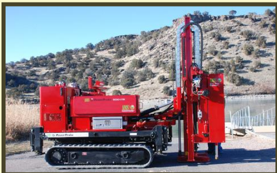
I5：9500 Series Power Probe