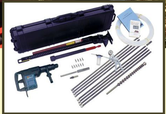
I2：土壤氣體採樣設備