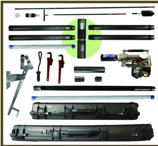
I3：動力式土壤採樣設備